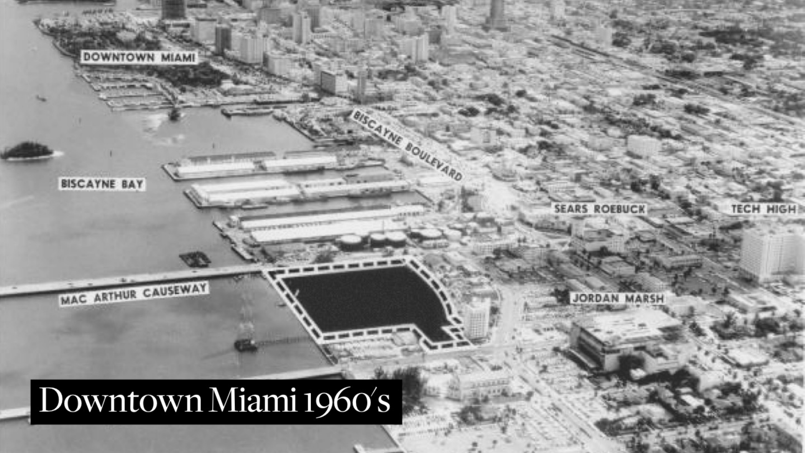
Downtown Miami 1960's