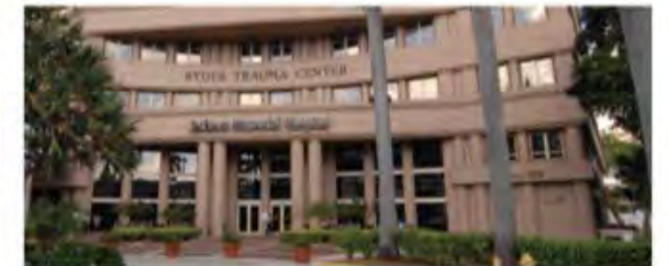
Jackson Memorial Hospital