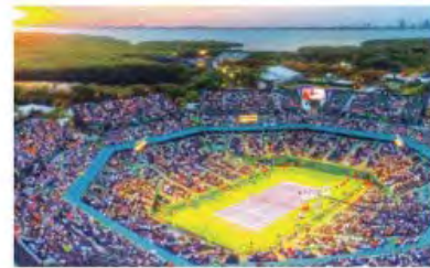
Miami Tennis Open