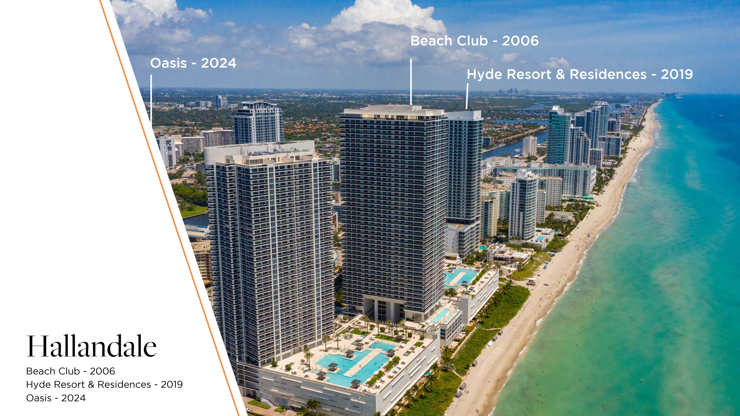
Beach Club - 2006