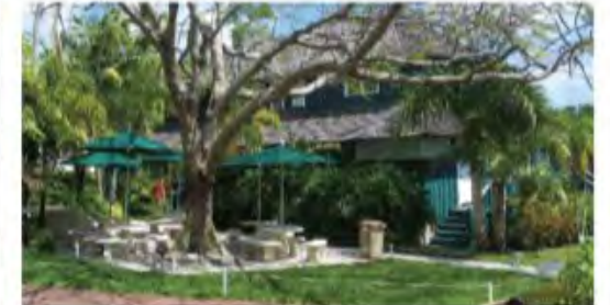
Ransom Everglades High School