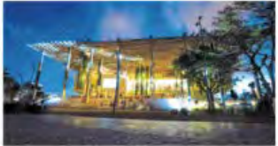
Pérez Art Museum Miami