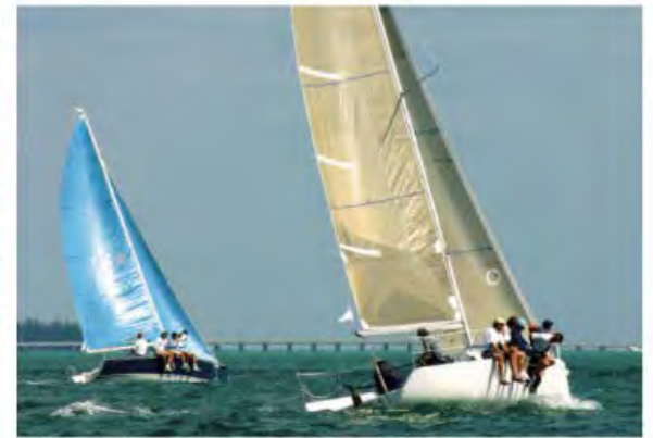
Sailing on the Atlantic Ocean and the Bay