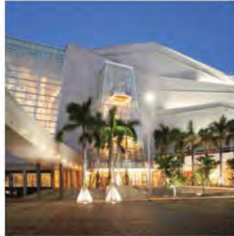
Adrienne Arsht Center