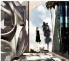
Buckminster Fuller Fly's Eye Dome