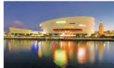
American Airlines Arena