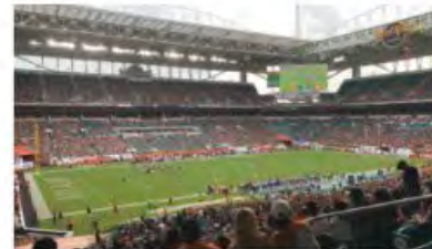
Hard Rock Football Stadium