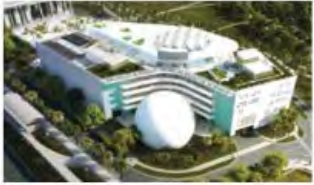
Frost Museum of Science