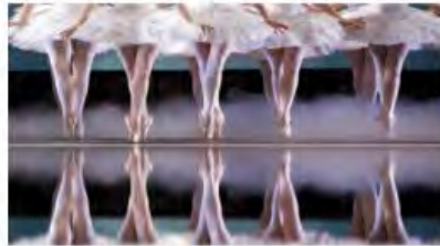
Miami City Ballet