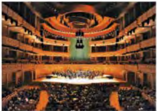
Knight Concert Hall