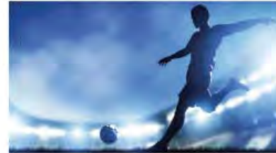
Miami Beckham United Stadium