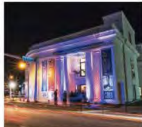
The American Museum of the Cuban Diaspora