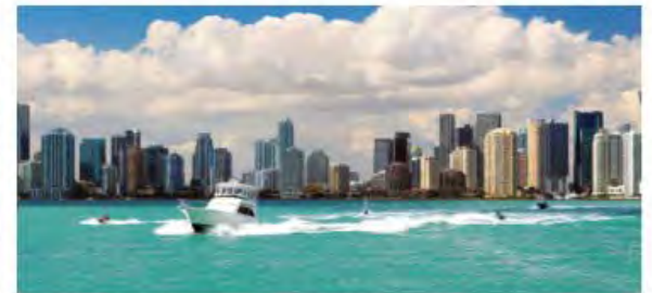
Jet-Skiing & Yachting on the Bay