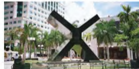
Miami-Dade Wolfson Campus