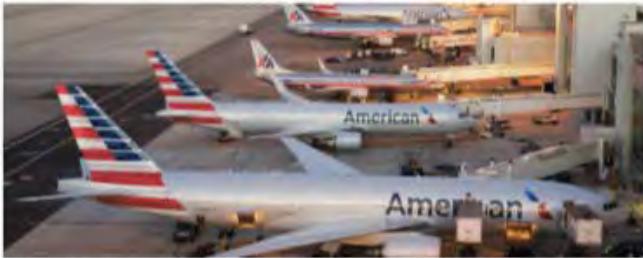
Miami International Airport