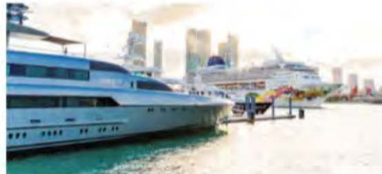
Island Gardens Deep Harbour Marina